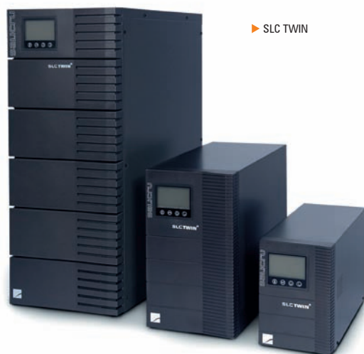
► SLC TWIN