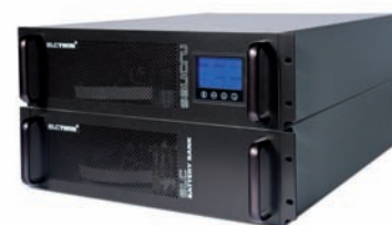
► SLC TWIN RACK 19"